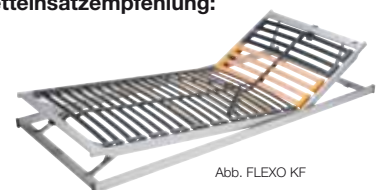
Abb. FLEXO KF

Bestens kombinierbar mit Produktlinie FLEXO