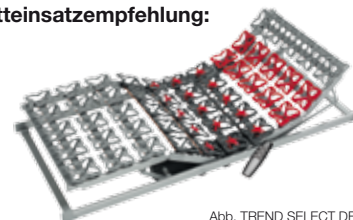
Abb. TREND SELECT DE LUXE

Bestens kombinierbar mit Produktlinie TREND SELECT ODER PREMIUM