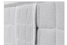
Extra breite Wendegriffe